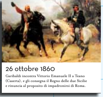
26 ottobre 1860 Garibaldi incontra Vittorio Emanuele II a Teano (Caserta), e gli consegna il Regno delle due Sicilie e rinuncia al proposito di impadronirsi di Roma.