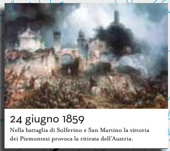
24 giugno 1859 Nella battaglia di Solferino e San Martino la vittoria dei Piemontesi provoca la ritirata dell'Austria.