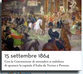
15 settembre 1864 Con la Convenzione di settembre si stabilisce di spostare la capitale d'Italia da Torino a Firenze.