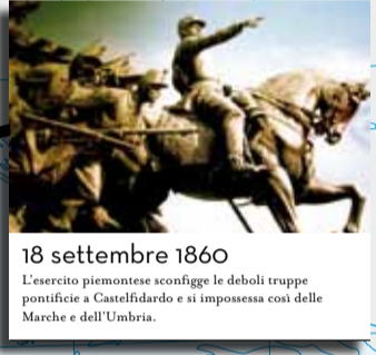
18 settembre 1860 L'esercito piemontese sconfigge le deboli truppe pontificie a Castelfidardo e si impossessa così delle Marche e dell'Umbria.