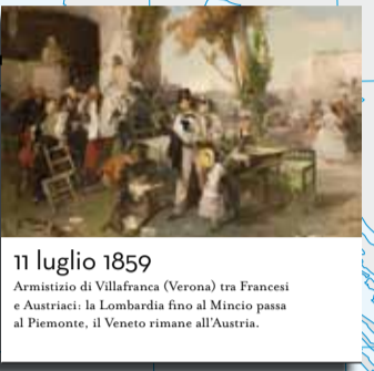
11 luglio 1859 Armistizio di Villafranca (Verona) tra Francesi e Austriaci: la Lombardia fino al Mincio passa al Piemonte, il Veneto rimane all'Austria.