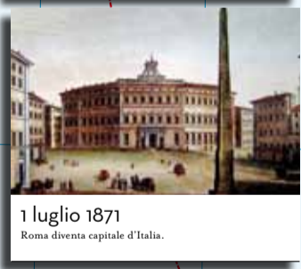
1 luglio 1871 Roma diventa capitale d'Italia.