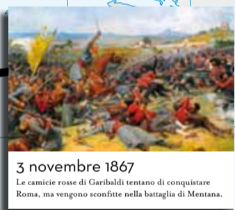
3 novembre 1867 Le camicie rosse di Garibaldi tentano di conquistare Roma, ma vengono sconfitte nella battaglia di Mentana.