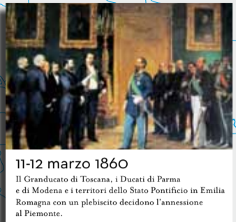
11-12 marzo 1860 Il Granducato di Toscana, i Ducati di Parma e di Modena e i territori dello Stato Pontificio in Emilia Romagna con un plebiscito decidono l'annessione al Piemonte.