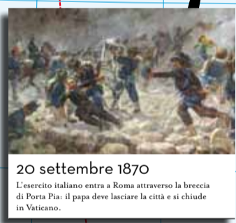
20 settembre 1870 L'esercito italiano entra a Roma attraverso la breccia di Porta Pia: il papa deve lasciare la città e si chiude in Vaticano.