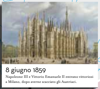
8 giugno 1859 Napoleone III e Vittorio Emanuele II entrano vittoriosi a Milano, dopo averne scacciati gli Austriaci.