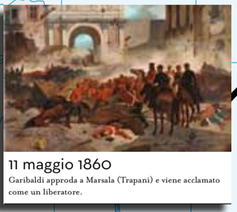
11 maggio 1860 Garibaldi approda a Marsala (Trapani) e viene acclamato come un liberatore.