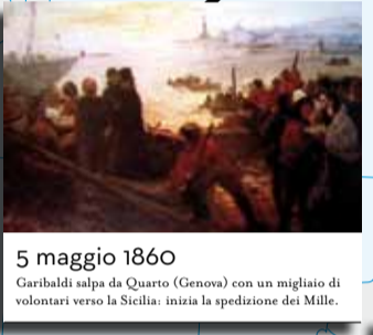
5 maggio 1860 Garibaldi salpa da Quarto (Genova) con un migliaio di volontari verso la Sicilia: inizia la spedizione dei Mille.