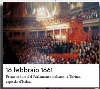
18 febbraio 1861 Prima seduta del Parlamento italiano, a Torino, capitale d'Italia.