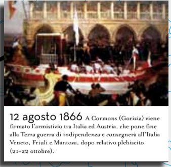
12 agosto 1866 A Cormons (Gorizia) viene firmato l'armistizio tra Italia ed Austria, che pone fine alla Terza guerra di indipendenza e consegnerà all'Italia Veneto, Friuli e Mantova, dopo relativo plebiscito (21-22 ottobre).