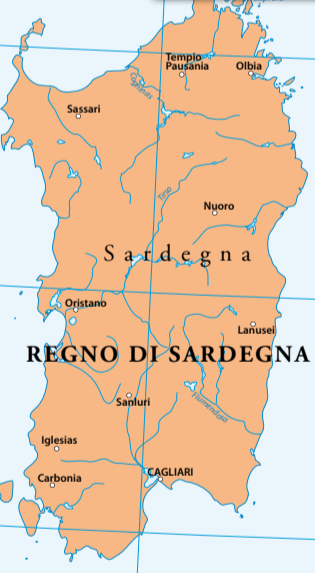
REGNO DI SARDEGNA